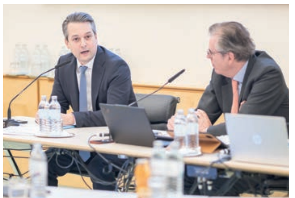
Dominik Nepp von der FPÖ kritisiert den Schuldenstand der Stadt Wien.