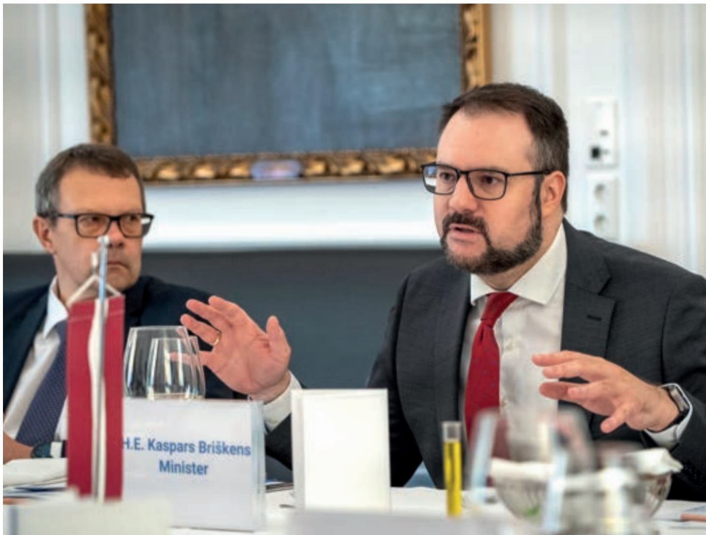
Der lettische Verkehrsminister Kaspars Briškens war für einen Austausch mit IV-Generalsekretär Christoph Neumayer und weiteren Experten aus Österreich zu Gast im Haus der Industrie.

Der lettische Verkehrsminister Kaspars Briškens spricht im Interview darüber, wie sein Land das Investitionsumfeld verbessert hat und auf welche Schlüsseltechnologien die Industrie in Lettland setzt.