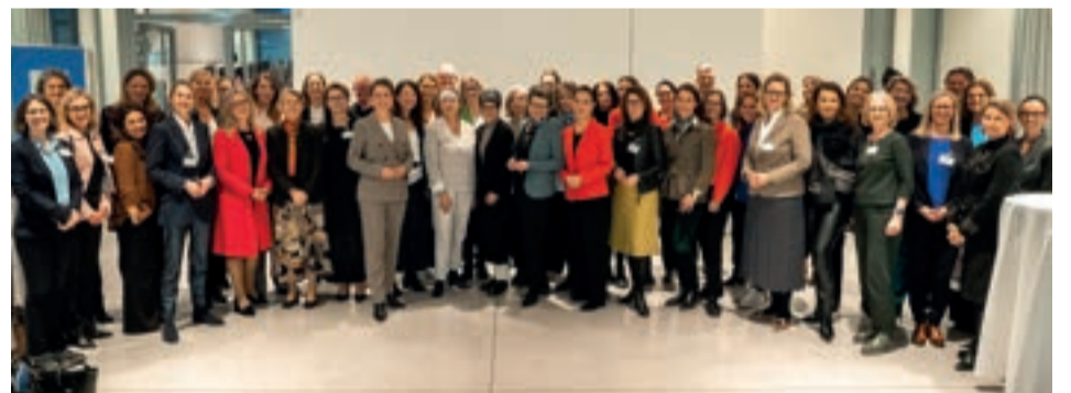
Die Teilnehmerinnen und Teilnehmer des 3. Durchgangs des IV-Sparringprogramms „Netzwerk Aufsichtsrat“.

In der Woche des Weltfrauentags fand zudem die feierliche Diplomverleihung des 25. Jahrgangs des Führungskräfteprogramms