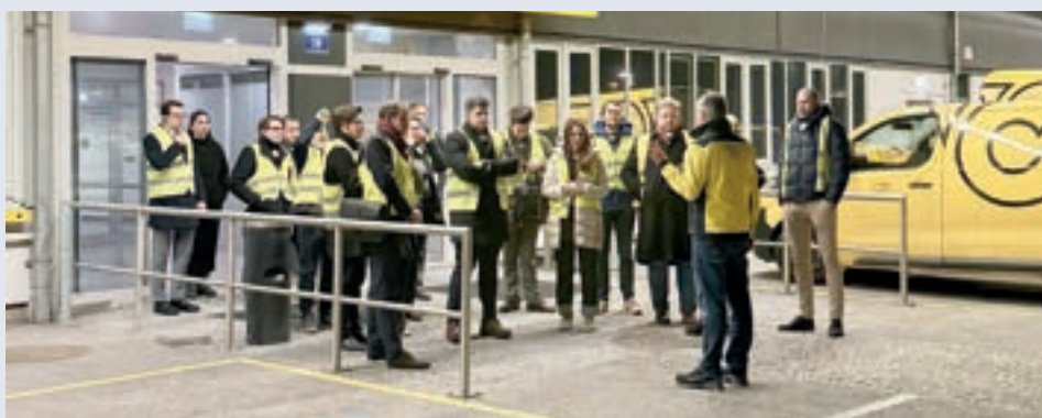
Das Paketlogistikzentrum in Wien-Inzersdorf.