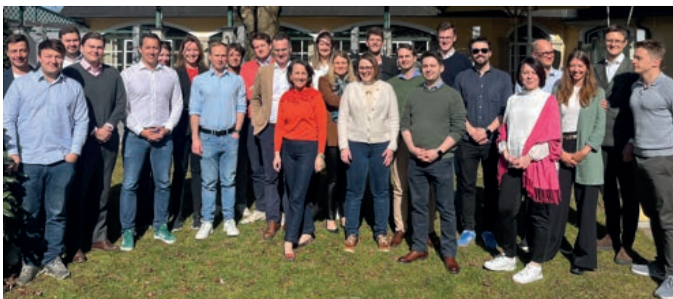
Der JI Leaders Circle.